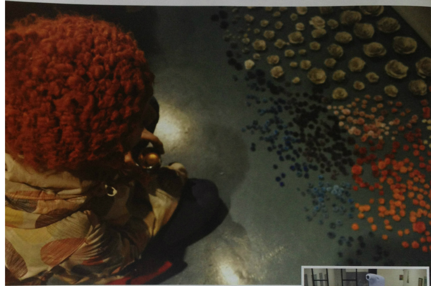
Halka Sanat Projesi